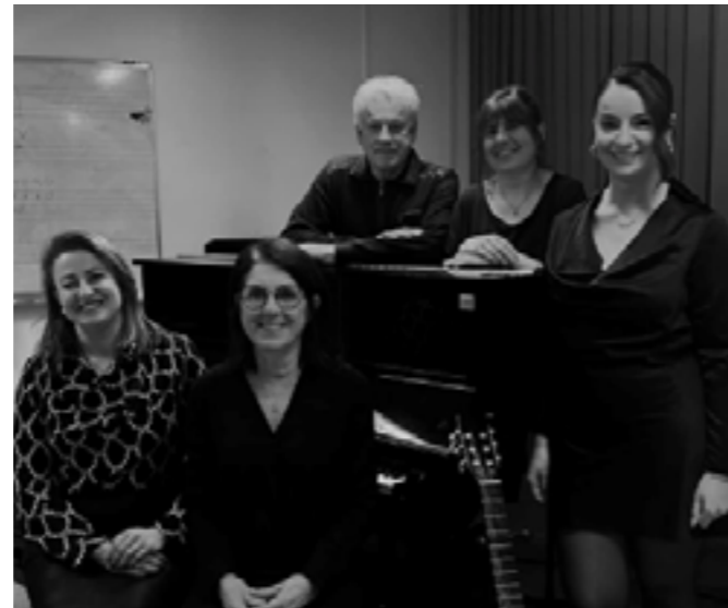
Organisées en février et avril, les auditions seront l'occasion de valoriser les progrès de chacun.

Pourtant, les réussites sont là ! L'école compte 120 élèves dont le tiers habite Nantua. On y vient à tout âge (de 3 à 70 ans) et de tous les milieux sociaux et culturels au point qu'elle a reçu une subvention du Crédit Agricole pour ses efforts en matière d'inclusion et d'insertion. La volonté d'ouverture se manifeste déjà par des interventions à l'école Sainte-Thérèse pour présenter la musique ou, comme récemment, au cinéma. Elles pourraient se développer dans d'autres établissements ou dans des communes alentour. « Notre but est de faire découvrir le monde magique de la musique, du son, de la danse. » Pour grandir et fidéliser ses élèves, l'école souhaite agir sur le coût de ses cours individuels, notamment en décrochant de nouvelles subventions pour compléter le soutien de la ville et du Département.