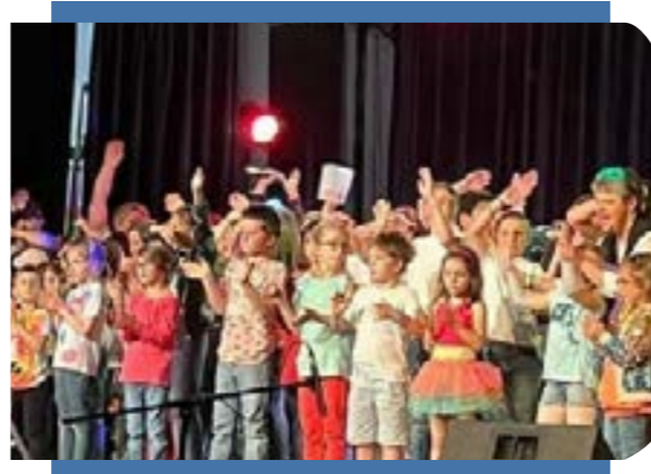
Scène de liesse lors du dernier spectacle de fin d'année