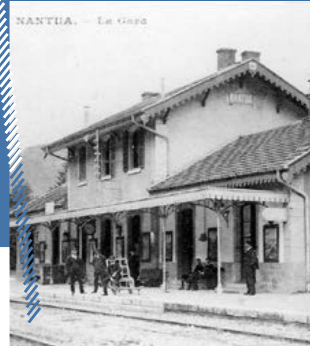
Créée en 1882, la gare de Nantua a fermé en 1990 avec l'arrêt du tronçon la Cluse-Bellegarde. La ligne a ensuite été restructurée entre 2005 et 2010 pour le passage des TGV Paris-Genève.

L'année est rythmée par des temps forts. Le défilé d'Halloween a été l'occasion de mélanger les publics, de rencontrer les commerçants et d'un moment de démonstration devant la mairie. L'école était présente au marché de Noël avant son spectacle à Brion. Enfin, le spectacle de fin d'année sur la scène de l'espace Malraux le 14 juin servira de point d'orgue.