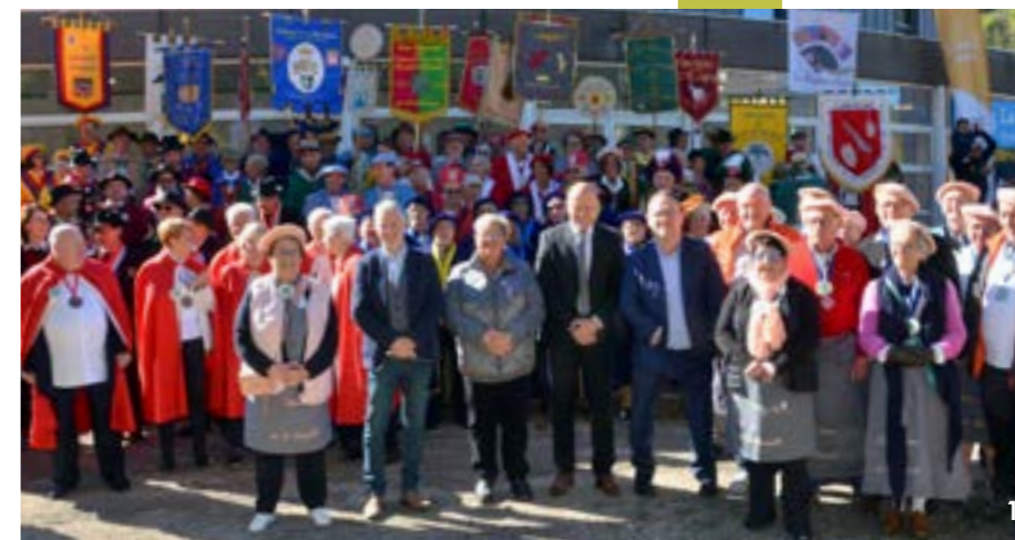
1. La 16 e édition de la fête de la quenelle a eu lieu le 5 octobre.