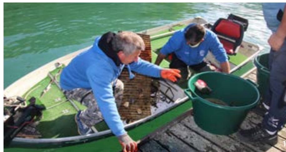
1. La coopération entre pêcheurs et plongeurs a été précieuse. 2. Des déchets variés et anciens.