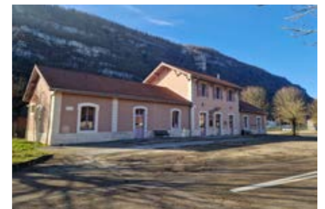
L'ancienne gare a été reconvertie en Espace de vie sociale.

Nantua soutient naturellement ce projet de prolongement de la ligne 6 du Léman express de Valserhône à Nurieux-Volognat. Cette extension, qui serait envisageable d'ici fin 2028, s'accompagnerait de la réouverture de plusieurs gares (Nantua, Saint-Germain-en-Joux, Moulin-de-Charix, les Neyrolles) et la mise aux normes de celles de Pyrimont et Brion-Montréal-la-Cluse.